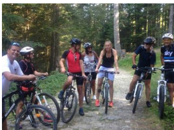
Randonnée VTT dans le Parc régional du Pilat, 8 Vttistes motivés.