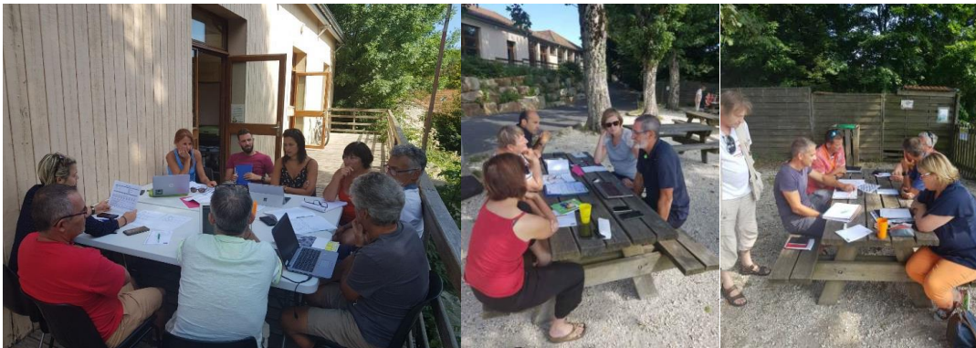
3 groupes de travail sur l'élaboration des projets régionaux : Camp Olympique, P'tit Touret Formation régionale d'animateurs « Vie associative ».